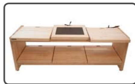
Verdeckte Kabelführung für die Verbindung der einzelnen Komponenten.