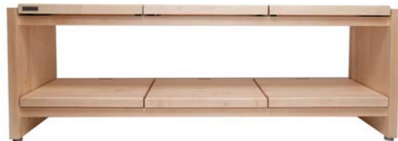
symphony: Jede Geräteebene ist einzeln schwingungsgedämpft gelagert.

Das Konzept der klangSTUBE Audio-Racks setzt genau dort an: Auf den Racks können die einzelnen Geräte durch separate Basen auf einem starren Rahmen so aufgestellt werden, dass diese qualitätsmindernden Effekte weitestgehend ausgeschaltet werden. Vereinfacht gesagt, sollen die Elektronen die Bauteile ohne Störeinflüsse durchfließen. Mit der richtigen Aufstellung kommt man diesem Idealzustand ein großes Stück näher. Im Klang wirkt sich das positiv auf die räumliche, präzise Darstellung aus und das Ergebnis ist eine höhere Dynamik in der Musikwiedergabe.